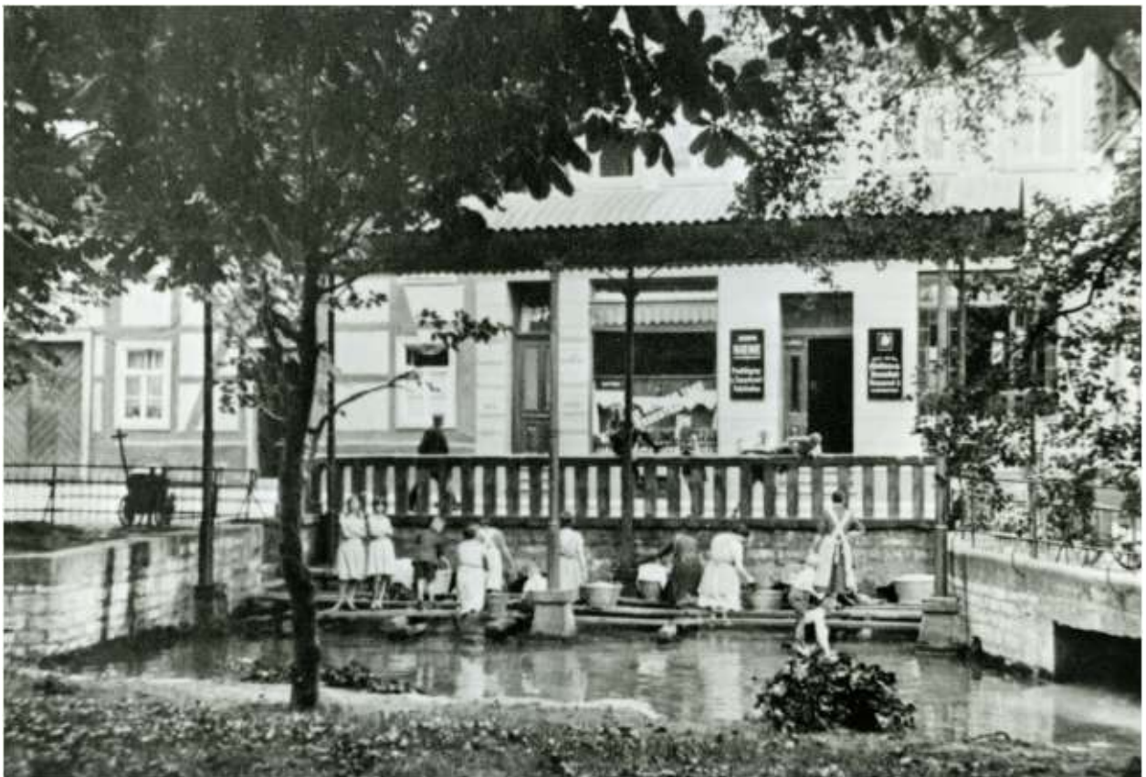
Waschplatz an der Warmen Pader um 1930

Im Herbst (September/Oktober) diesen Jahres wird in der Stadtbibliothek die Ausstellung „Paderborn - Stadt des Wassers“ gezeigt. Dabei sind etliche Pader-Fotos zu sehen, und das ein oder andere für das „Storytelling“ im Quellgebiet wird es auch geben. Über den genauen Termin der Ausstellung informieren wir Sie in einem der nächsten Rundschreiben.